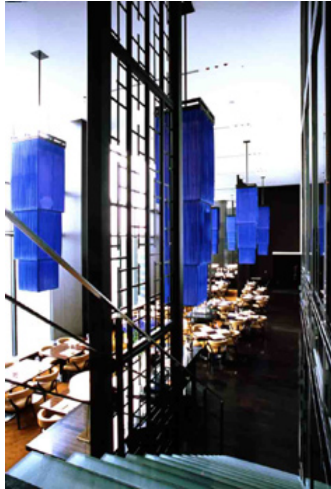
China Blue, Conrad Tokyo, Japan