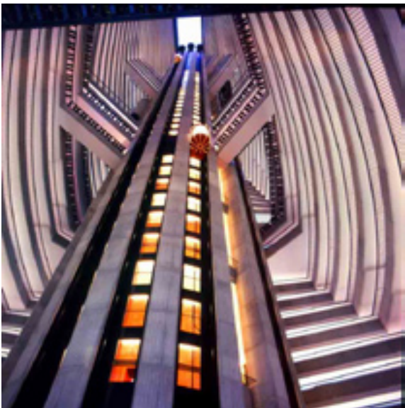
Left : Marriott Marquis Atranta Georgia, USA Right : Les Ambassadeurs Hotel de Crillon Paris, France

パブリック・スペースとは、ホテルに泊まっていないお客さまも自由に入出りできる空間のことである。ロビー、ラウンジ、バー、レストラン、宴会施設、そしてこれらをつなぐ歩廊や階段もこれにあたる。「ここにどのような空間設計とデザインを配し、お客さまにアピールするか」は、近代ホテルが誕生してから 1 世紀半たったいまもつづいている、永遠の熱いテーマである。本書に紹介するパリの超一流ホテルとして知られるホテル・ド・クリヨンやリッツ・パリは、歴史的な重要建造物の指定を受け、パブリック・スペースの改築・改装は許されない。その代わり、建設時のインテリアを真新しく修復していて驚かされる。もちろん観光客の気軽な立入りはできないが、時代が変わり食事やティーなら誰でも歓迎である。クリヨンのレストラン「レ・アンバサドル」は、王妃マリー・アントワネットが出席した旧舞踏会場であり、彼女が見たと同じルイ 16 世様式の壮麗なインテリアが大迫力で迫ってくる。ひと口にホテルといっても、ヨーロッパではクリヨンやリッツのような所もあり、インテリアもクラシックからコンテンポラリーなど多岐に渡っている。