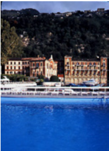
Left : Villa d'Este Right : The Greenbrier White Surphur Springs, West Virginia, USA

In America hot-springs resorts first appeared around springs that were discovered during the pioneering days of the American West. The area around our first hotel, The Greenbrier, was said to have originally been a secret spot of the Shawnee Indian tribe. The original hotel on the site, The Old White, was used for secret meetings of the Confederate Army near the end of the US Civil War, and it was also used as a hospital for soldiers. At the beginning of the 20th century a large-scale hotel was established, along with three golf courses and an exclusive airport, and it became an elegant playground for wealthy Americans. Because of this it had the reputation as a resort that every American wanted to experience at least once. The Greenbrier has now bought up all the land around the hot springs. With its hotel, golf courses and spa, it provides a very comfortable environment for visitors, and it is an excellent example of a successful large-scale American resort.