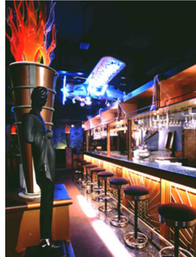
The Musictheque Hotel Istana, Kuala Lumpur, Malaysia