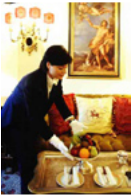
Left : St.Regis Grand Hotel, Rome. Italy Georgia, USA Right : Royal Stairway Hotel Imperial, Wien, Austria