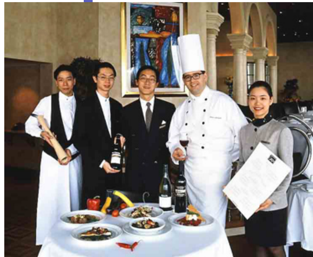
Grissini, Grand Hyatt Hong Kong, Hong Kong, China

1990年代の初め頃からアジアのホテルで目立つようになったものに、中国料理レストランのインテリアをウェスタン・デザインにする動きがあることだ。その代表例として、本書冒頭に登場するグランド・ハイアット・ホンコンの「ワン・ハーバー・ロード」は、それまでの中国提灯、朱塗の柱、中国スクリーン・パネル、壁を飾る中国墨絵をやめ、香港の英国租借時代に大班（タアバンまたはタイパン）と呼ばれた英国領事が住んだ館のヴェランダを模したインテリアをここにデザインして話題になった。この動きも15年が経ち、トレンドを過ぎ、もうひとつのスタイルになったと見てもいいのではないだろうか。