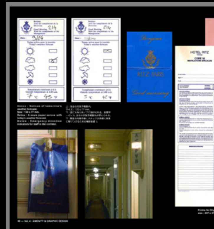
Ritz Paris, Paris, France