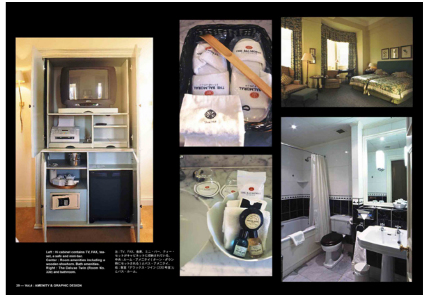
The Balmoral, Edinburgh, Scotland, UK