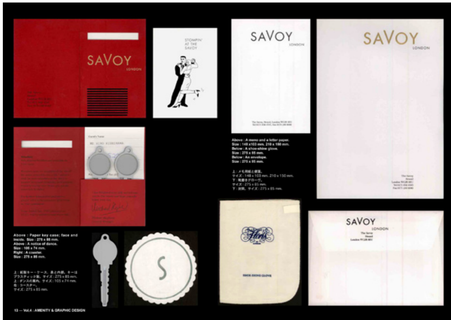
Above : A menu and a letter paper. Size : 148 x 103 mm, 210 x 150 mm. Below : A shoe-shine glove. Size : 275 x 85 mm. Below : An envelope. Size : 275 x 85 mm.