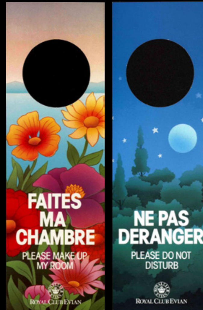
Evian Royal Resort, Evian, France

ドアタグ (起こさないでください ほか)。朝食用ドアタグ。レター・セット類。キーとケース。ラウンドリー用紙。コメント・シート。荷物タグ。FaX 用紙。翌日の天気予報案内。絵葉書 ほか。